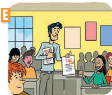
Dialogue n° .....