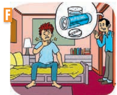
Dialogue n° .....