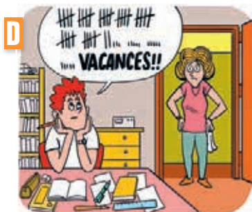
Dialogue n° .....