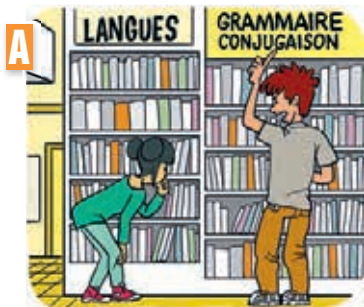
Dialogue n° .....

Écoutez et notez sous chaque image le numéro du dialogue correspondant.