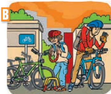
Dialogue n° .....