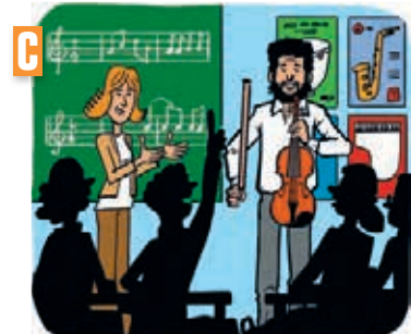
Dialogue n° .....